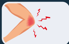
Dolor del codo