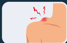
Dolor de hombro