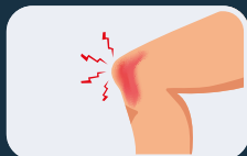
Dolor de rodilla