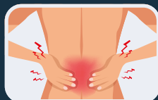
Dolor de espalda